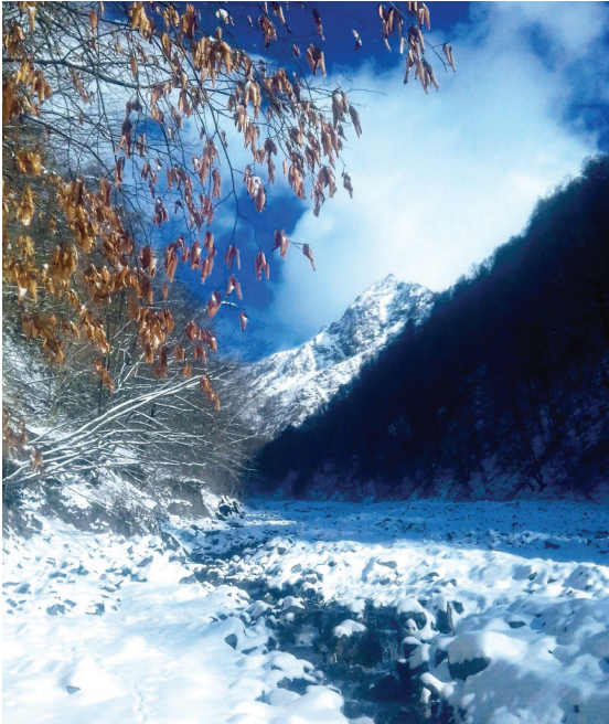
Şəkil 3. Qax rayonu, Ağçay kəndi, Xəznə dağının Dünyadik zirvəsi.

İsmayıl Qullari 1809-cu ildə Ağçay kəndindəki Hacı Şəmsəddin məscidində zəvvar Hacı Əbdəllah Əfəndi Nuxəvinin tələbəsi qismində təhsil alaraq xəttatlığa yiyələnmiş və qeyd edilən