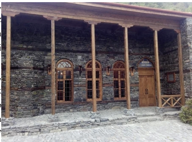
Şəkil 4. Qax rayonunun Sarıbaş kəndində 2019-cu ildə bərpa və təmir edilmiş məscid

Türk tədqiqatçıların qənaətlərinə əsasən, “sarıbaş” sözünün mənası (“sarı”, “sari” türk sözləri olub, rəng mənasını bildirir) həm də “tərəf”, “istiqaqət” deməkdir. Bu məzmununda “sarıbaş” sözü “başa tərəf”, “baş tərəf” anlamları ilə də uyğun gəlir. Türk xalqlarında “sarı başlı” ifadəsi ilə həm də igid, qəhrəman kəs nəzərdə tutulmuşdur [9, s.303]. Bu adla Şəki rayonu ərazisində Sarıqaya, Kəlbəcər rayonunda Sarıyer oronimləri işlənir [5, s.58-59]. Ukraynanın Kırım Muxtar Vilayətində eyniadlı kənd vardır.