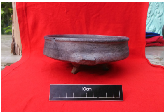
Şəkil 8. Vaza tipli gil qab