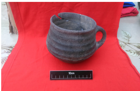
Şəkil 7. Parç

Qəbir kamerasının şərq küncündəki insan kəlləsinin ətrafından mavi, ağ və yaşıl rəngli pasta muncuqlar aşkar edildi. Bundan əlavə, qəbir kamerasında 2 ədəd dəmir xəncər, 9 ədəd gil qab tapıldı ( şəkil 6 ). Gil qablar qazan, boşqab, parç ( şəkil 7 ), 2 küpə, vaza ( şəkil 8 ), bardaq ( şəkil 9 ), 2 ədəd xeyrə tipli gil qablardan ibarət idi. Dəmir xəncərlər eyni uzunluqda (23 sm) olub, eyni formada idilər.