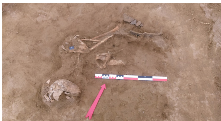
Şəkil 12. İnsan skeletinin qalıqları (5 №-li qəbir)

Torpaq qəbir 65 sm dərinlikdən aşkar edildi. Qəbir 4-cü kvadratdan tapıldı. Qəbir kamerasının torpağı ətrafın gilli bərkimiş torpağından seçilirdi. Qəbir kamerası 1,7x2 m olub, zəngin deyildi. Kamerada aşkarlanan insan skeletinin sümükləri xaotik vəziyyətdə idi. Burada parçalanaraq dəfn etmə ayininin izləri müşahidə olunurdu (şəkil 12). Kəllə üzüstə torpaqda qalmış, onurğa sümükləri dağılmış, çanaq və bud sümükləri kəllənin yanından tapılmışdı [1, s.14-15]. Alt çənə yox idi. Çiyin sümükləri təmizlənən zaman bir ədəd dəmir ox ucluğu tapıldı. Ehtimal etmək olardı ki, bu, döyüşçü olmuş, hərbi əməliyyat zamanı çiyindən oxla yaralanmış və yerində çabalayaraq ölmüşdür. Bir müddət sonra onun meyiti tapılmış və elə bu vəziyyətdə də basdırılmışdır. Qəbir kamerasında yalnız bir ədəd xeyrə tipli gil qab aşkar edildi.