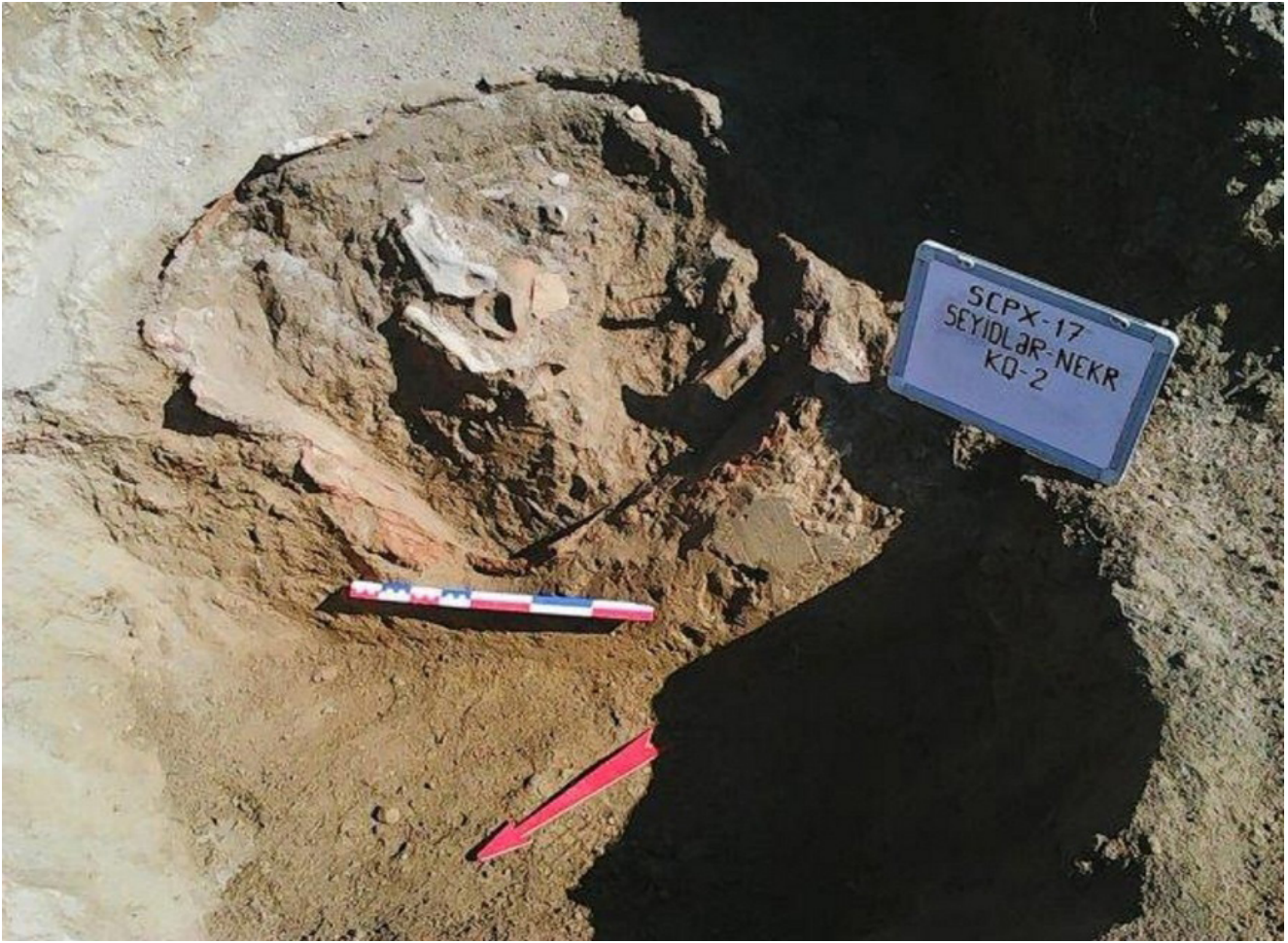
Şəkil 2. 2 №-li küp qəbir

Dəfn küpünün içindən heyvana məxsus sümük fraqmentləri, oturacaq hissəsindən kül qatı tapıldı. Dəfn küpünün daxilindən tapılan artefaktlar aşağıdakılar idi: