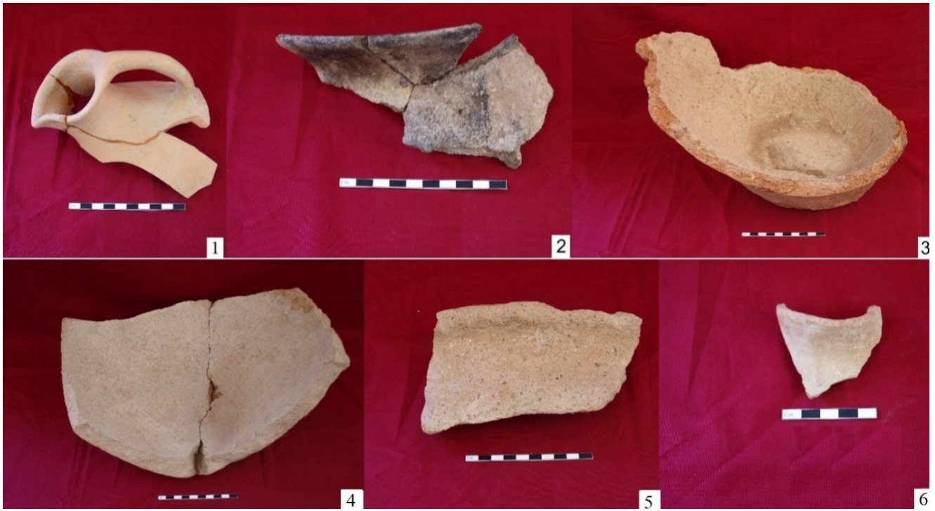
Şəkil 5. Keramika fraqmentləri

Tapıntılar arasında yalnız 1 nümunə ilə təmsil olunan şüşə məmulatı muncuqdan ibarətdir. Muncuq tünd göy rəngdə olub kiçik ölçülüdür. Kəsikdə dalğavari formada olan muncuğun deşiyi üstədən başlayır. Yastı formadadır. Uzunluğu 2,2 sm-dir.