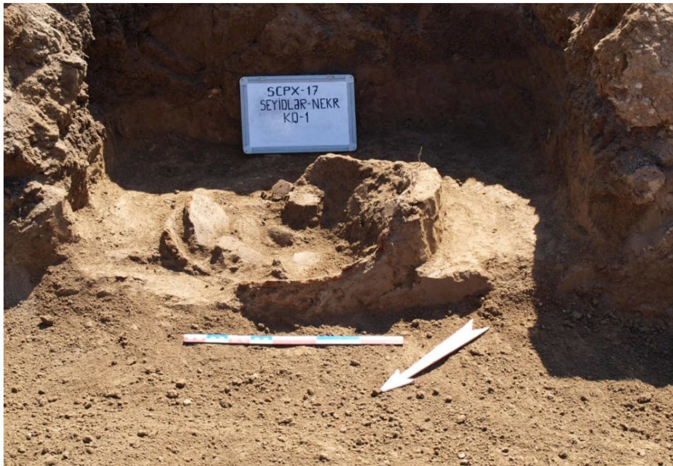
Şəkil 1. 1 №-li küp qəbir

2 №-li küp qəbir. 1 №-li küp qəbirdən 3 metr cənub-şərq istiqamətdə yerləşən qəbir müasir yer səthindən 50 sm dərinlikdə aşkar edilmişdir (şəkil 2). Qazıntı işləri 1,4 m dərinliyə qədər davam etdirilmişdir. Qalın divarlı, şaquli vəziyyətdə qoyulan dəfn küpünün yan və üst hissəsi texniki təsir nəticəsində tamamilə dağılmışdır [1, s.5-6]. Dəfn küpünün qoyulduğu qəbir kamerasının qalan hissəsi 110 sm təşkil edir [1, s.6]. İrihəcmli dəfn küpünün ağız hissəsi yana açılır. Ağız köbəli, boğazı isə hündür olub çiyinə doğru genişlənir. Rəngi çəhrayı olan küp səliqəli hazırlanmış, üzəri cilalanmışdır. Gil tərkibi az qum qarışıqlı dəfn küpünün ağız diametri 41 sm, oturacaq diametri 20 sm, divar qalınlığı 1,9 sm, gövdə diametri isə 1 m-dir.