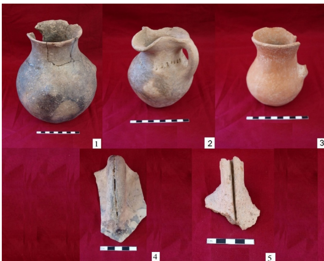
Şəkil 4. Gil qablar və saxsı qulp fraqmentləri

saxsı qablardan və dəfn küplərinin içərisinə qoyulmuş kiçik həcmli qab nümunələrindən ibarət idilər. Saxsı qablar bir qayda olaraq açıq çəhrayı və qırmızı rəngdədir (şəkil 4-5). Onların bir qisminin üstü ağ və sarı rəngdə anqoblanmışdır. Gil tərkibi qum qatışıqlı və ya təmizdir. Qabların əksəriyyəti dulus çarxı tətbiq edilmədən əldə hazırlansa da, onlar çox keyfiyyətli, yüksək bədii zövqlə hazırlanmış və yaxşı bişirilmişdir. Qeyd edək ki, öyrənilən dövrdə antik dünyası ilə yaranmış əlaqələrin təsiri altında Qafqaz Albaniyasının şəhərlərində bişmiş kərpiclərdən istifadə etməyə, antik tipli dam kirəmitləri və gil qablar hazırlamağa, yunan sikkələrini təqlid edən pullar zərb etməyə başlamışdılar [8, c.183-186]. Çox güman ki, Seyidlər küp qəbirləri nekropolunun dəfn adətində istifadə edilmiş gil qablar nekropolun aid olduğu yaşayış yerinin sənətkarlıq məhsuludur.